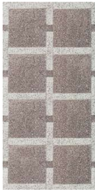
Kombinationen aus den Platten 5005 und 705