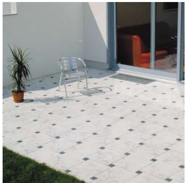
Verlegebeispiel: 810 kombiniert mit 940