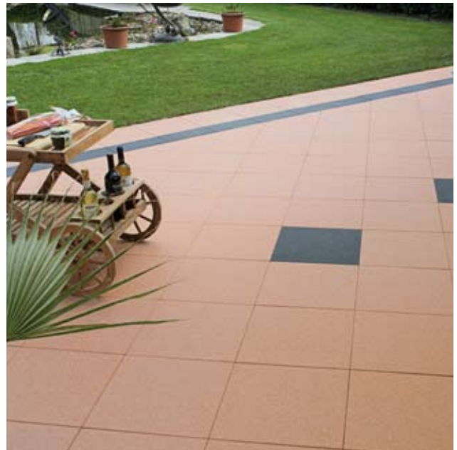
Verlegebeispiel: Kombination aus 110 und 40