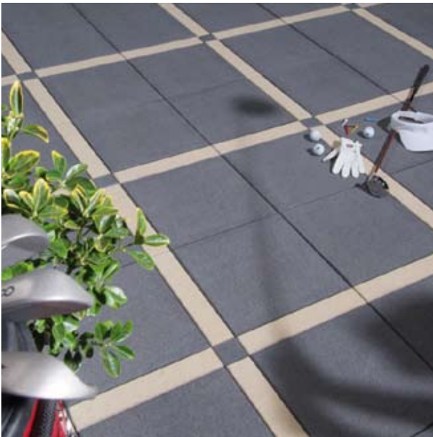
Verlegebeispiel: 940 (40 x 40 cm und 7 x 7 cm) kombiniert mit 910 (40 x 7 cm)