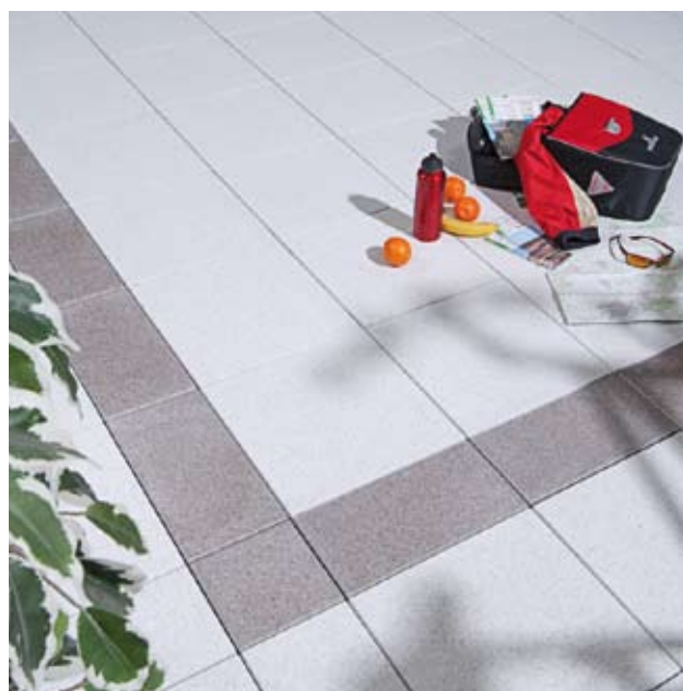
Verlegebeispiel: S5005 (40 x 40 cm) kombiniert mit 705 (40 x 20 cm)