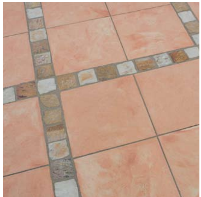
Verlegebeispiel: 60 kombiniert mit Regenbogenquarzit