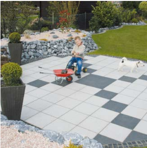
Verlegebeispiel: 10 kombiniert mit 40