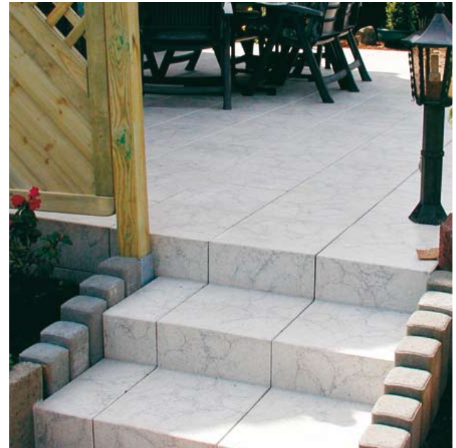
Verlegebeispiel: 810 mit verlängerten Schenkelstufen