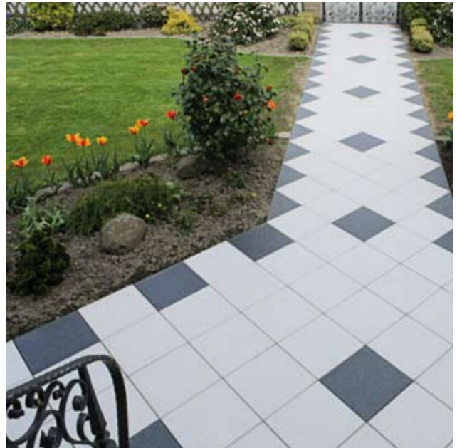
Verlegebeispiel: 20 kombiniert mit 40