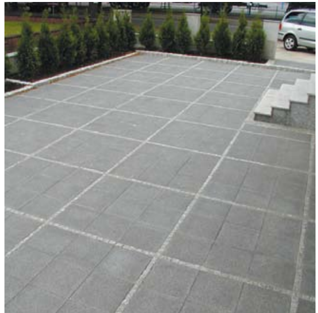
Verlegebeispiel: 1040 mit Streifen aus Natursteinpflaster (4 x 6 cm)