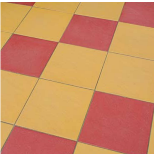
Verlegebeispiel: 150 kombiniert mit 160